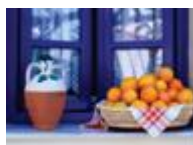
B&B Catherina Hoeve